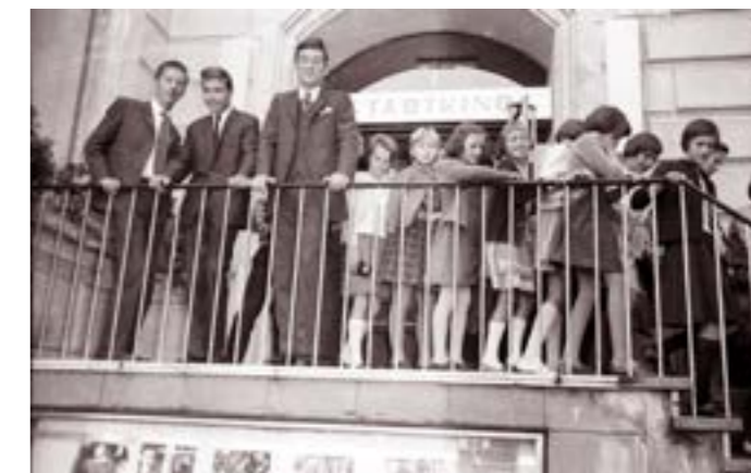
Nach der Kinovorstellung, Anfang 1970er Jahre.