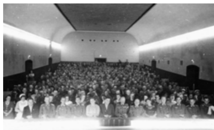
Filmpräsentation zur Eröffnung des neuen Kinos in der Theatergasse 1, 1941.