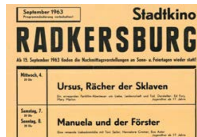
Programm des Stadtkinos Radkersburg, Ausschnitt, September 1963.