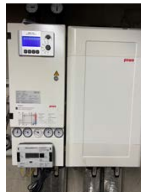
Fernwärmeübergabestation mit Wärmetauscher

Wir möchten versichern, dass wir immer bemüht sind, den Kundinnen und Kunden wettbewerbsfähige Preise zu bieten und weiterhin laufend in eine sichere und qualitativ hochwertige Energieversorgung zu investieren.