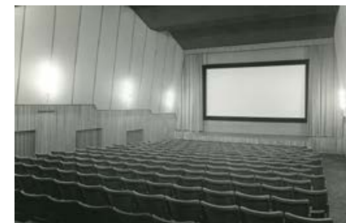
Der umgebaute Kinosaal am Grazertorplatz.