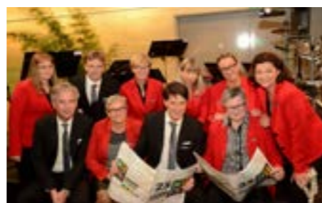
Der Vorstand des Kulturforums gestaltet das kulturelle Leben der Stadt, © Kulturforum