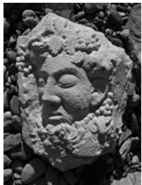
Bacchus in Sandstein gemeißelt, Werk und Foto Simbürger