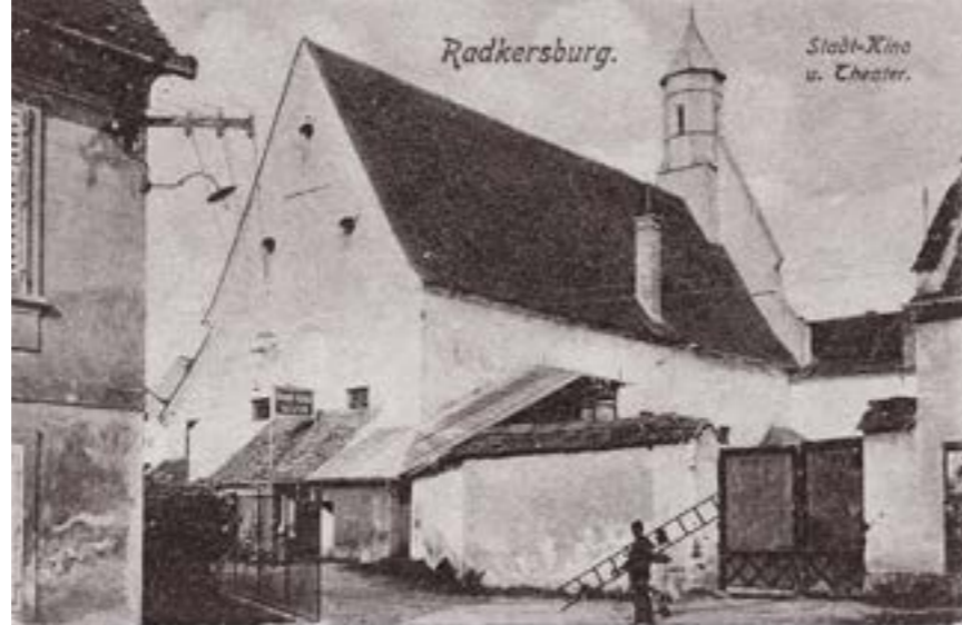
Stadt kino und Theater in der Kapuzinerklosterkirche 1919.