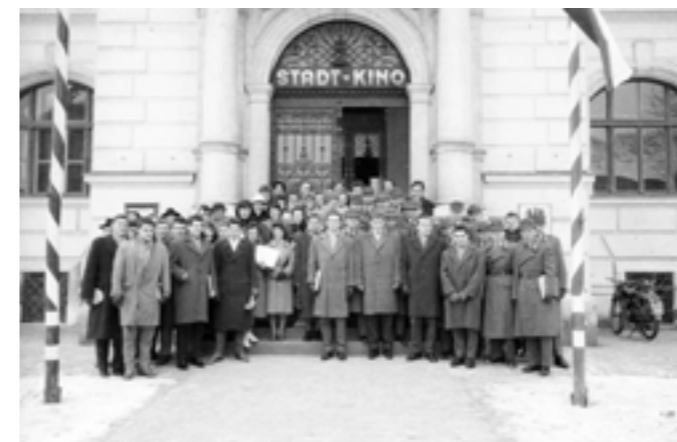
Jungbürgerfeier vor dem Stadtkino, 1960.