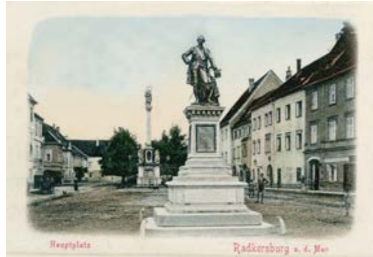
Ansichtskarte mit dem Denkmal Josef II., MiaZ

Das MiaZ war auch im Frühjahrsprogramm der „Urania Bad Radkersburg“ mit einer Veranstaltung vertreten: Im Stadtbild finden sich zahlreiche Denkmäler, die uns an bedeutende Ereignisse der wechselvollen Geschichte der Stadt oder bemerkenswerte Persönlichkeiten erinnern sollen. Im Rahmen der Spezialführung „Erzähl mal, Denkmal!“ konnten die Teilnehmerinnen und Teilnehmer erfahren, wann, weshalb und von wem ein solches Denkmal errichtet wurde.