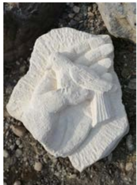
Hand mit Friedenstaube, Werk und Foto Simbürger