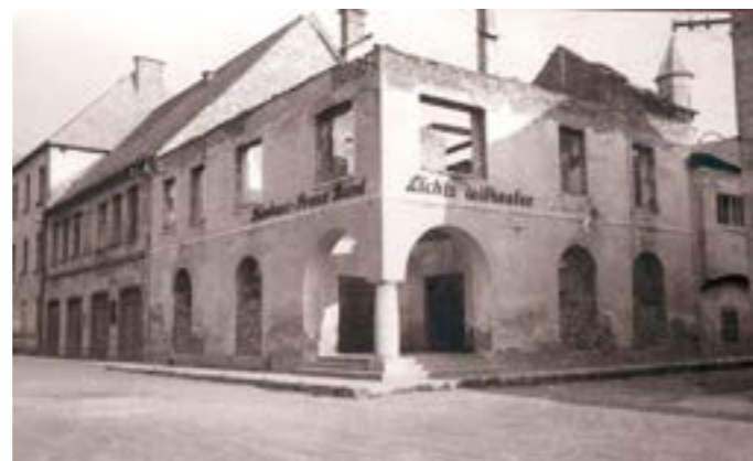
Abgebranntes Kino in der Theatergasse-Ecke Hauptplatz, 1945.