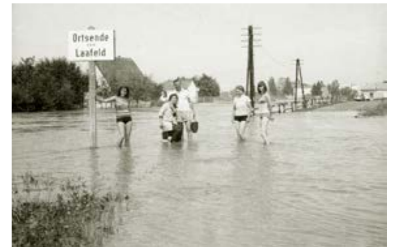
Hochwasser 1966.

Eröffnung der Sonderausstellung: Mittwoch, 29. Juni 2022, 18.30 Uhr Ort: Innenhof des Museums im alten Zeughaus